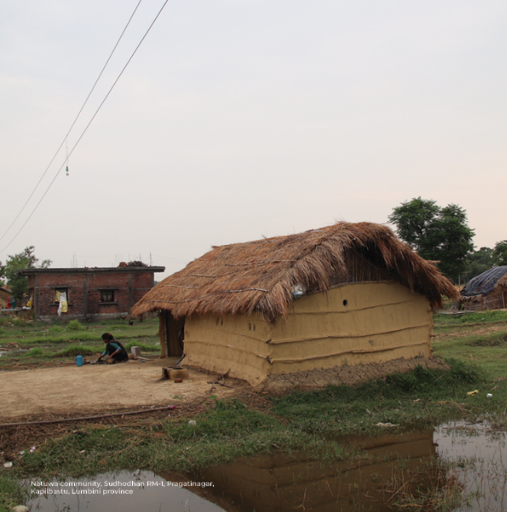
Natuwa community, Sudhodhan RM-1, Pragatinagar, Kapilbastu, Lumbini province