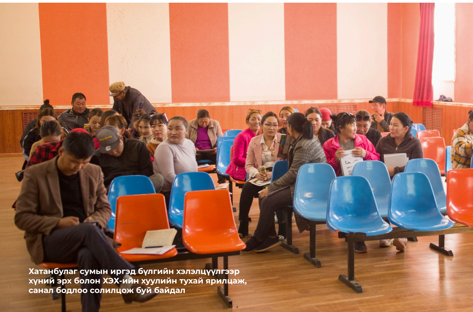
Хатанбулаг сумын иргэд бүлгийн хэлэлцүүлгээр хүний эрх болон ХЭХ-ийн хуулийн тухай ярилцаж, санал бодлоо солилцож буй байдал