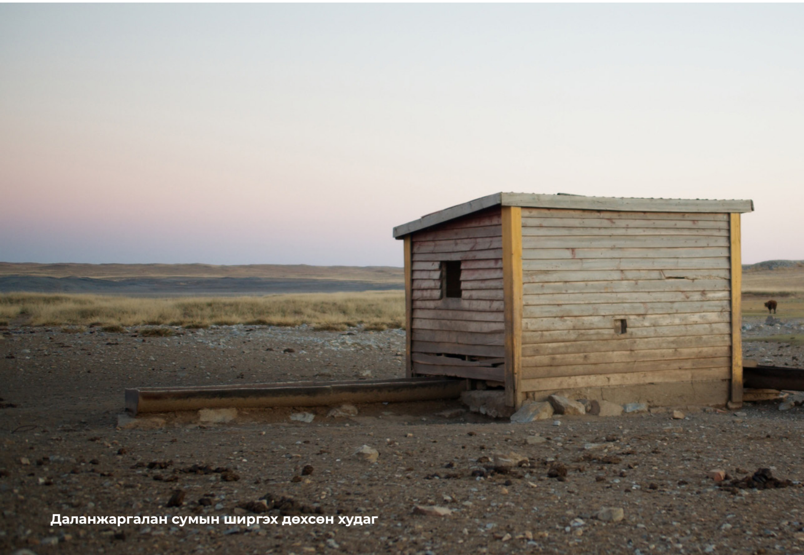
Даланжаргалан сумын ширгэх дөхсөн худаг

Бэлчээрийн газар хайн нутаг сэлгэн нүүх нь малчин өрхийн хүүхдийн боловсролд шууд нөлөөлдөг байна. Орон нутгийн удирдлагуудтай хийсэн хэлэлцүүлгийн үеэр нийт бага насны