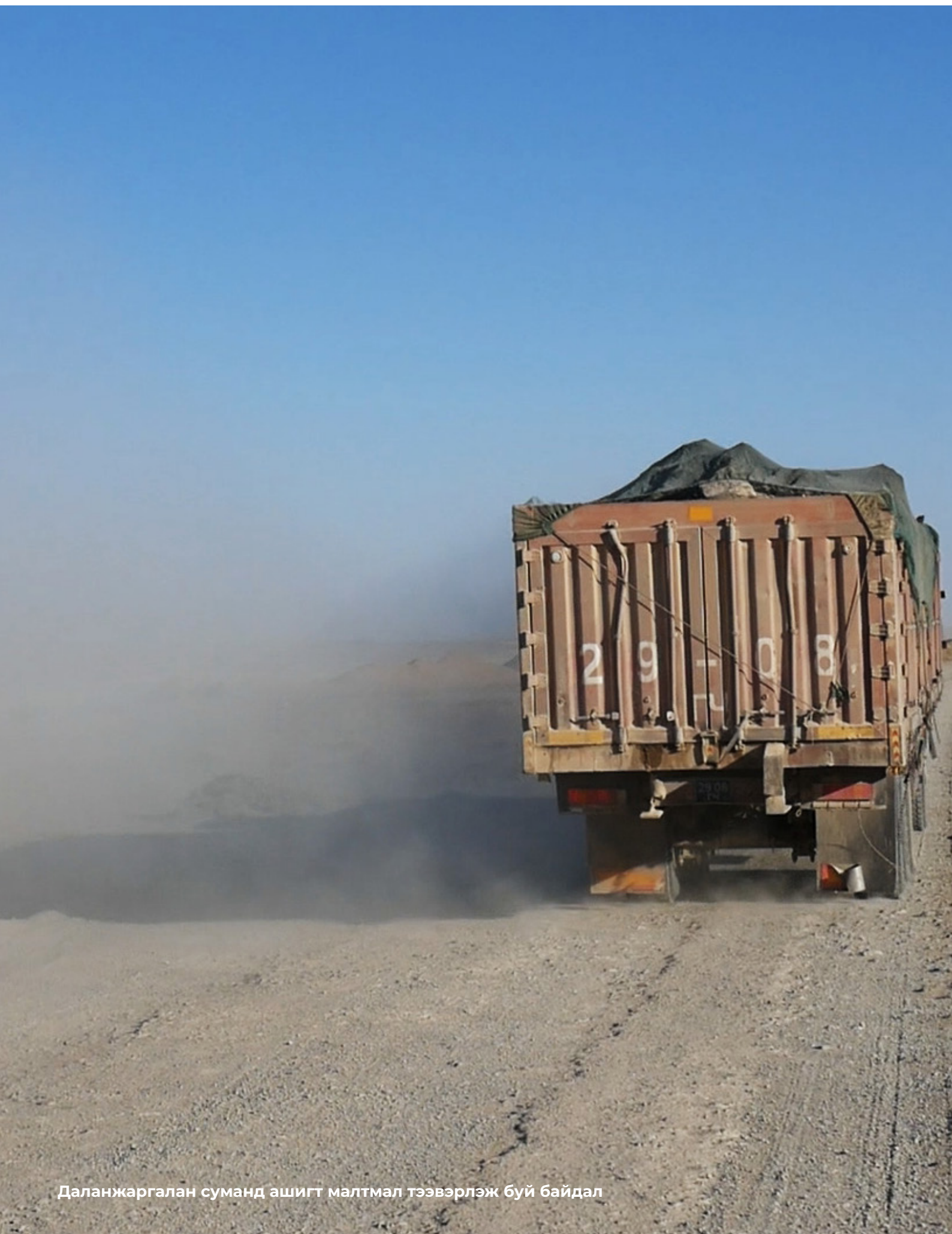
Даланжаргалан суманд ашигт малтмал тээвэрлэж буй байдал