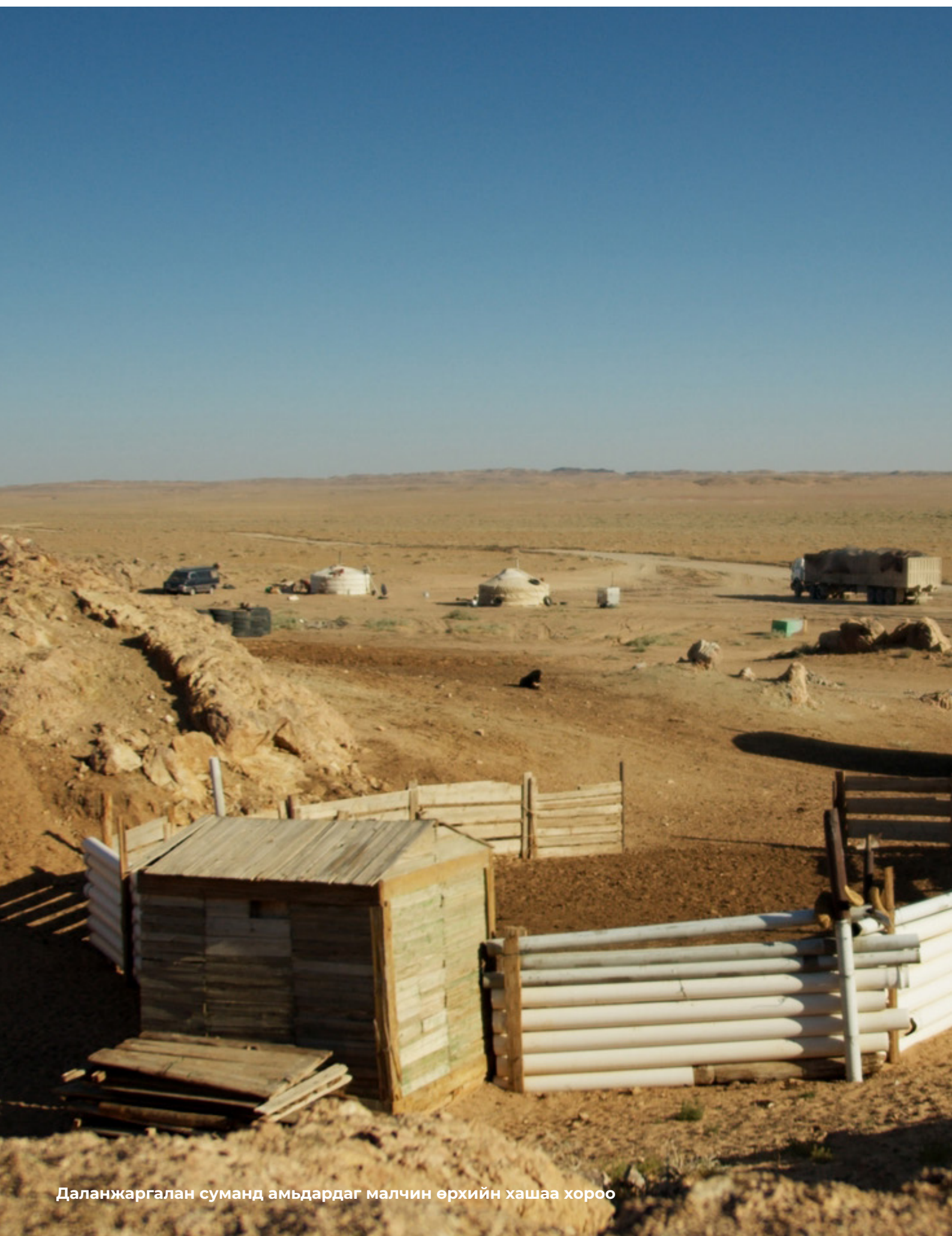
Даланжаргалан суманд амьдардаг малчин өрхийн хашаа хороо