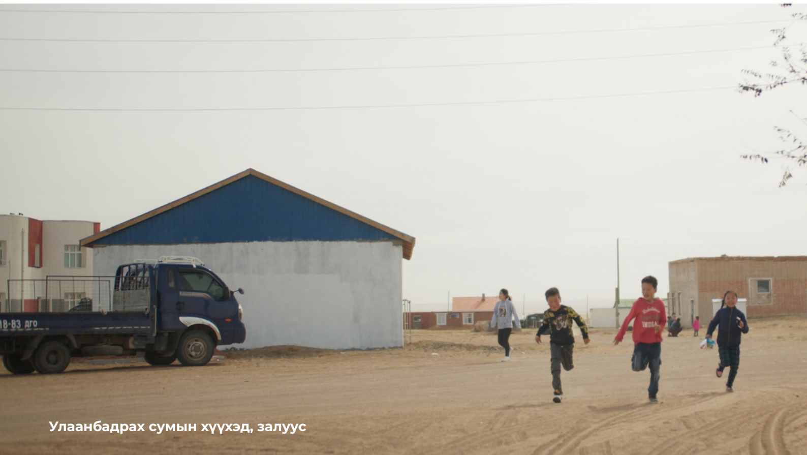
Улаанбадрах сумын хүүхэд, залуус

Малчид малаа төхөөрөхөд малын элэг, уушиг идээлж, бүтцийн өөрчлөлтөд орсон байдаг тул малын дотор гэдсийг хаяж, харьцангуй гайгүй хэсгийг нь өөрсдөө идэх эсвэл бусдад зардаг гэж байлаа. Улаанбадрах сумын махыг хүмүүс авахаа байсан болохоор малчид малаа өөр сумынх гэж гарал үүслийг нь нуун зардаг