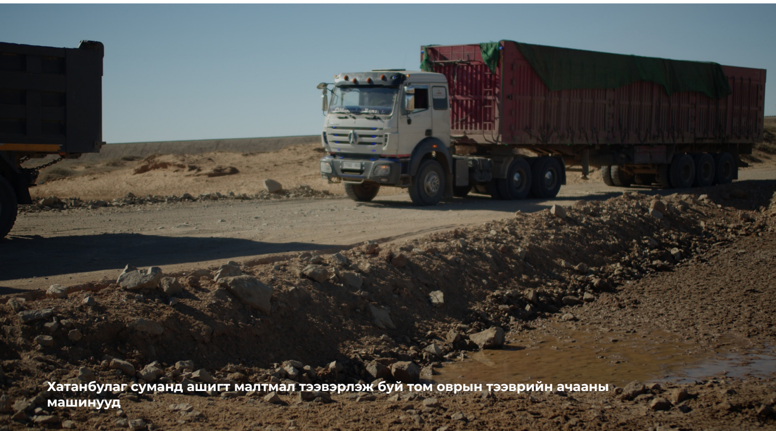
Хатанбулаг суманд ашигт малтмал тээвэрлэж буй том оврын тээврийн ачааны машинууд

Ерөнхий сайдынажлыналбанаас боловсруулсан тайланг зөвхөн аймгийн удирдлагуудтай хэлэлцэн, уг тайлангийн дүгнэлттэй холбоотой ямар нэгэн арга хэмжээ огт авагдаагүй талаар судалгааны багийнханд иргэд хэлж байсан. Иргэд уг тайлантай танилцах хүсэлт гаргахад тайланд агуулагдаж буй мэдээлэл нууцад хамаарна хэмээн татгалзсан хариу авсан байна. Мөн аймгийн удирдлагууд иргэдийг дараагийн арга хэмжээ авахыг нь хааж боогдуулах замаар иргэдийн эсрэг байр суурьтай байсан нь илэрхий байсан ба иргэдийн дуу хоолойг хүртэл дарахыг оролдож байсан гэжээ. Бадрах Энержи компанийн тухай Facebook пост оруулсан