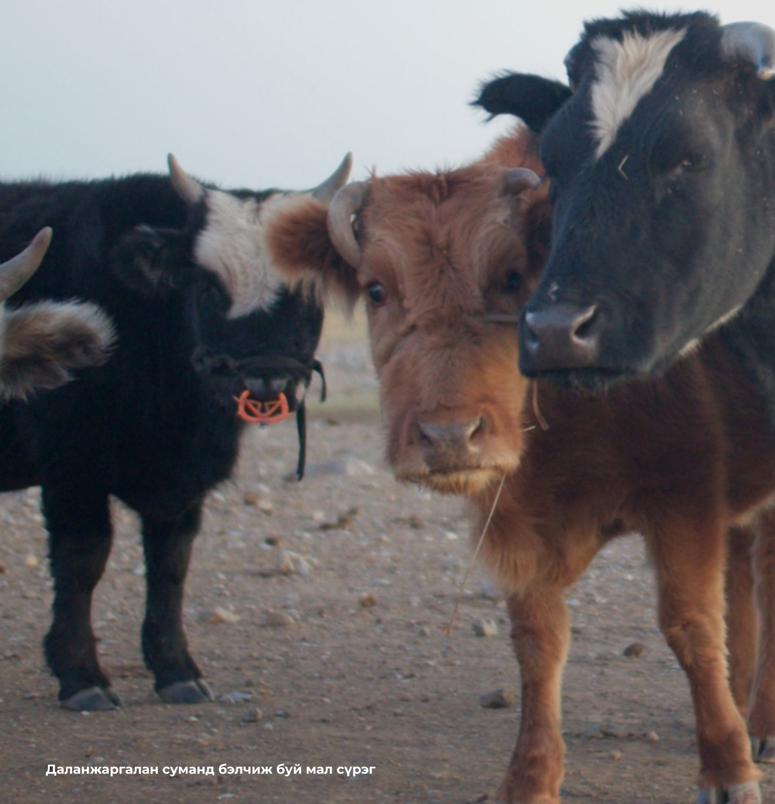
Даланжаргалан суманд бэлчиж буй мал сүрэг